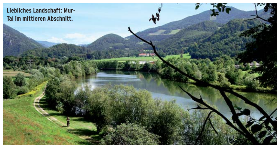
Liebliches Landschaft: Mur-Tal im mittleren Abschnitt.