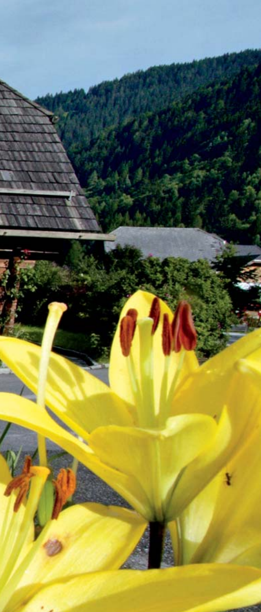
Urig: Kendlbrunn mit seinen alten Bauernhäusern.

brannten Zirbelschnaps und lenke mein Rad am Drei-Schuppen-See vorbei weiter zu Tal.