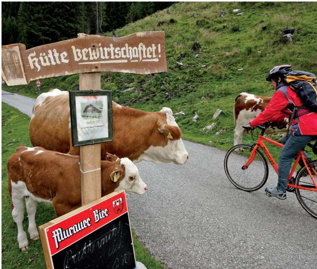
Rustikal: An der jungen Mur führt die Route an der Jacklbauer-Alm vorbei.