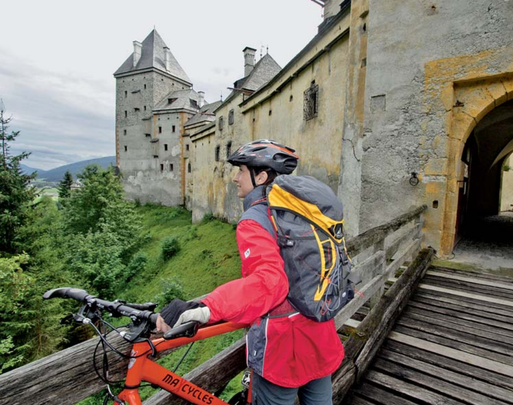
Lohnender Abstecher: des Ausblicks wegen hinauf zum Schloss Moosham.