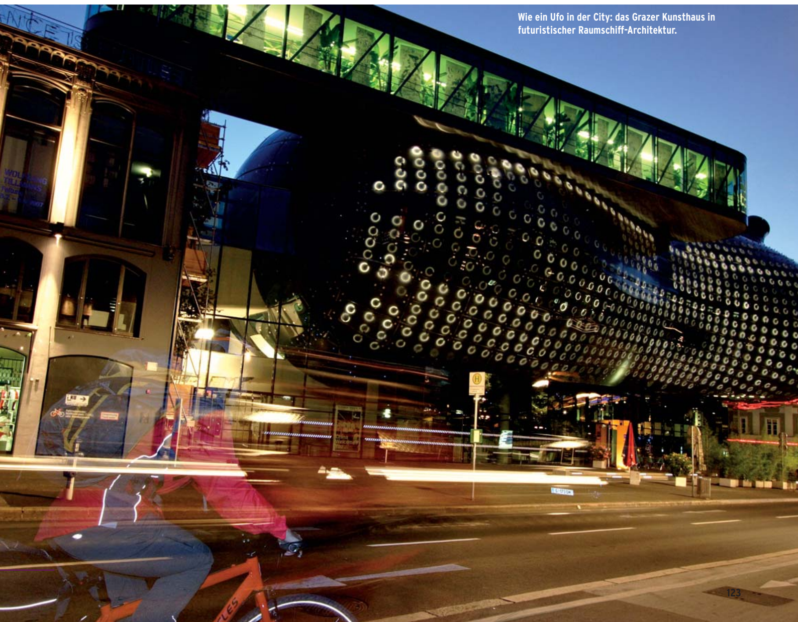
Wie ein Ufo in der City: das Grazer Kunsthaus in futuristischer Raumschiff-Architektur.

österreichisch-slowenischen Grenze entgegen. Die hohen Berge sind mittlerweile aus dem Blickfeld verschwunden, neben Weingärten übernehmen Kürbisfelder das Regiment über die Kulisse. Schilder am Radweg werben für Kürbiskernöl, Kürbis-Knabberkerne und eine steirische Musikgruppen namens „Die Pumpkins“. In Spielfeld taucht das letzte von sechs aufeinanderfolgenden Wasserkraftwerken auf, danach bleibt die Mur, die auf den folgenden 33 Kilometern die Grenze zu Slowenien bildet, der Natur überlassen. Bei Mureck tauche ich in urwüchsige Auwälder ein. Ich erspähe einen Eisvogel, der wie ein fliegender Edelstein über die Wasseroberfläche schnell. Begutachte eine von der Mur aufgeschotterte Kiesinsel, die seltenen Fischarten als Laichplatz dient. Auf der letzten Etappe des bei Bad Radkersburg endenden Radweges ist die Mur weder Kunstfluss noch Energieerzeuger. Also tut sie wieder das, was sie aus eigener Kraft am besten kann – nämlich Naturparadiese erschaffen.