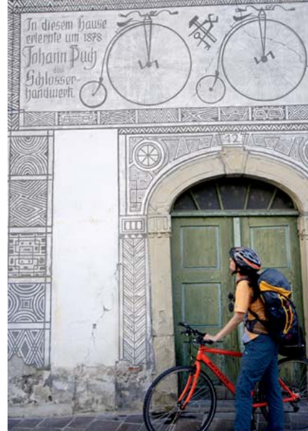
Fahrrad-Pionier: am Haus von Johann Puch.

E-Mail: altneudoerflerhof@aon.at , www.altneudoerflerhof.at Hotel Das Weitzer, Grieskai 12-16, A-8020 Graz, Tel. 0043-316/7030, Fax 0043-316/703629, E-Mail: hotel@weitzer.com , www.weitzer.com Frohnleitnerhof, Hauptplatz 14 a, A-8130 Frohnleitner, Tel. 0043-3126-4150, Fax -4150555, E-Mail: info@frohnleitnerhof.at , www.frohnleitnerhof.at