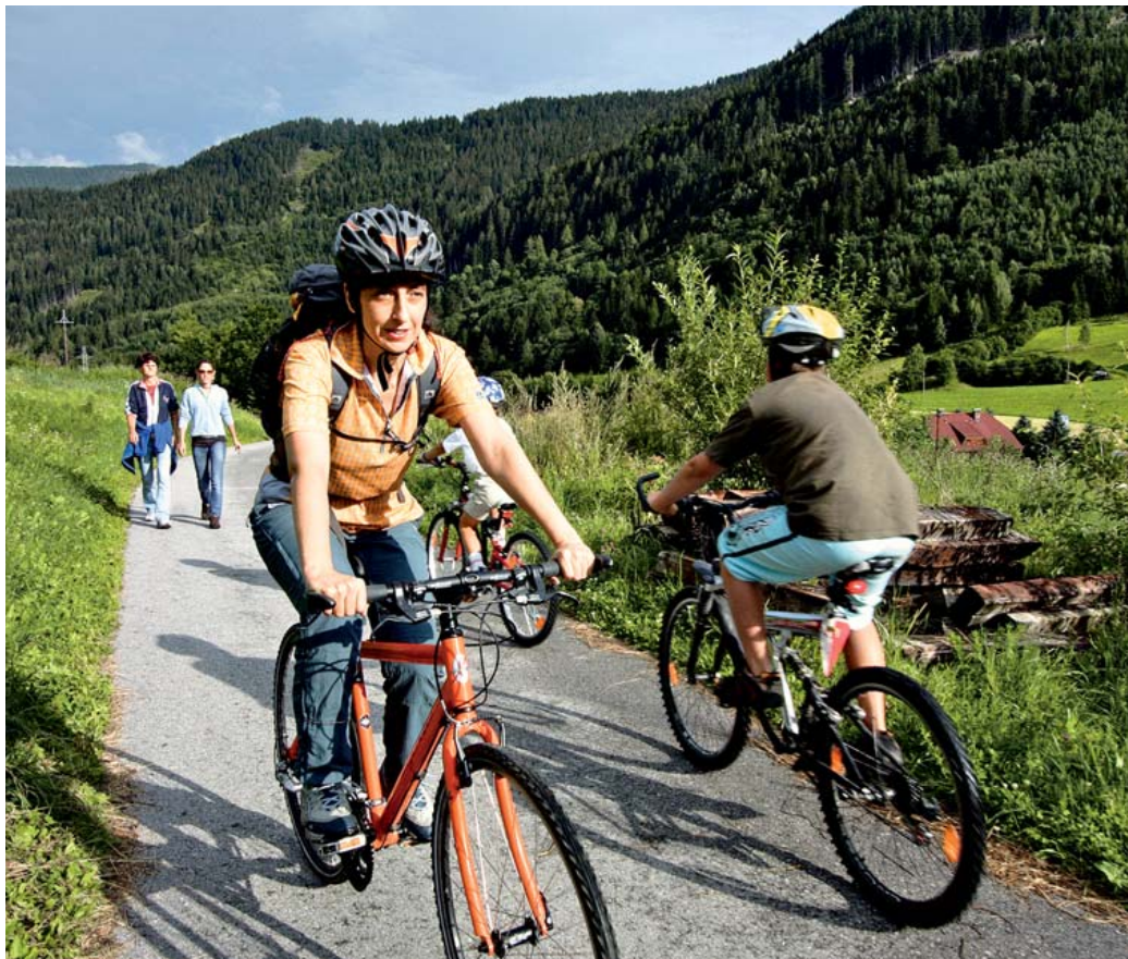
Harmonisch: Wanderer und Radler kommen sich auf dem Mur-Radweg kaum in die Quere.

Während ich noch beobachte, wie die kleine Mur durch diese Riesenbaustelle fließt, fällt die Straße steil hinab nach Jedl. Die Mur tut es ihr gleich und bildet gleich um die